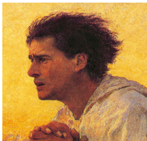
LUIGI GIUSSANI IL SENSO RELIGIOSO Volume primo del PerCorso